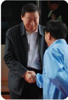
原江苏省省委书记罗志军