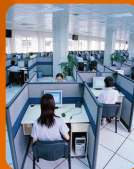
IT技术人才培养基地

网络双创基地建设和网络基地建设，加快培育发展新动能、打造发展新引擎，推动区域经济和社会发展。