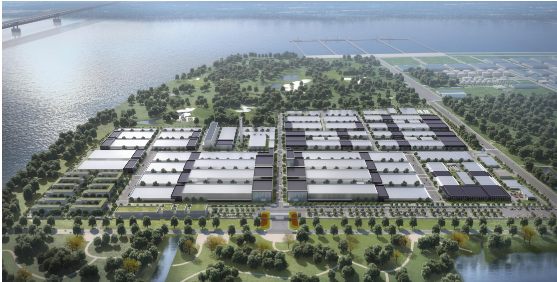
康辉南通新材料科技有限公司产业基地鸟瞰图